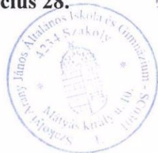
Birta Ferenc intézményvezető